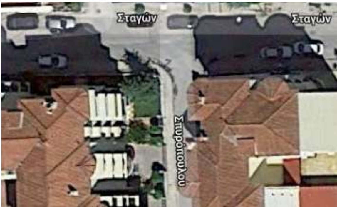
Ο δρόμος στη Λάρισα

Ως το ελάχιστο για τη θυσία του, στην γενέτειρα του εκλιπόντος, τη Λάρισα, δίνεται το όνομά του σε δρόμο της πόλης, ενώ το ίδιο κάνει και ο Δήμος Μοσχάτου, κοντά στο σημείο του θανάτου του.