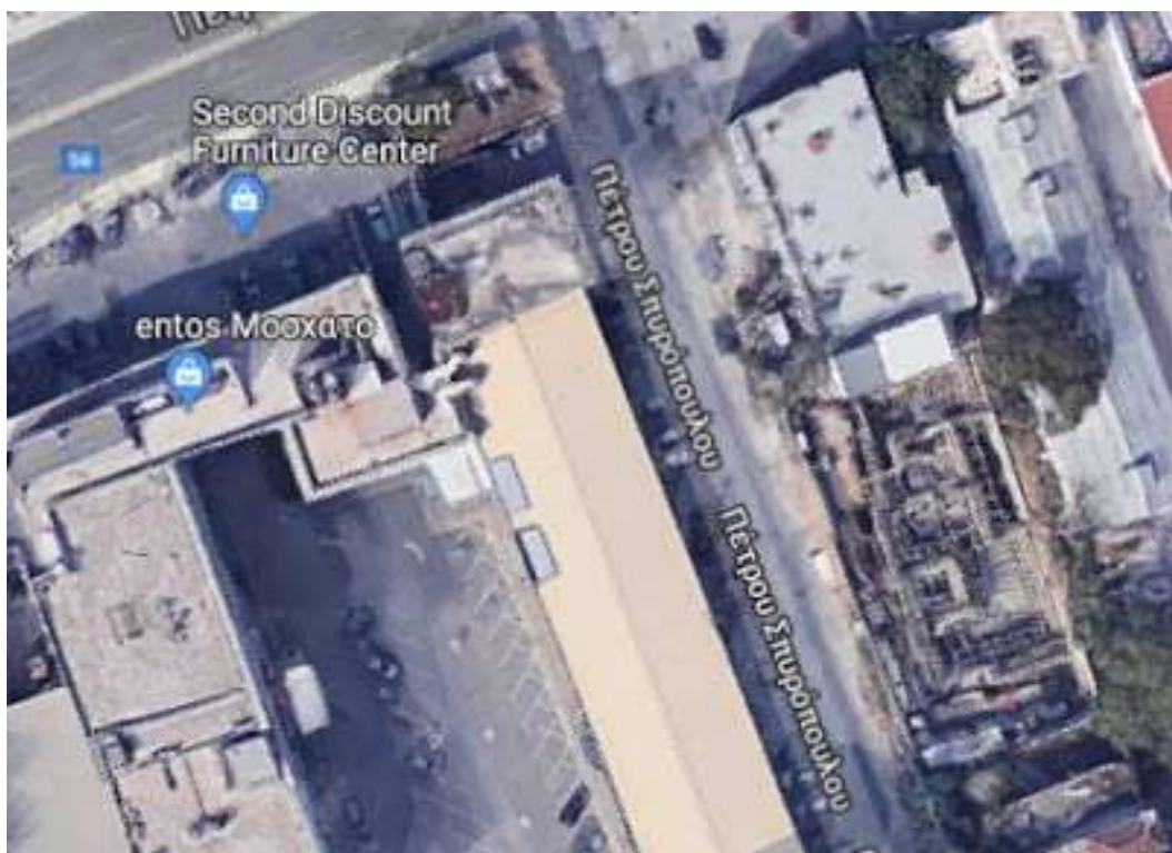
Ο δρόμος στο Μοσχάτο